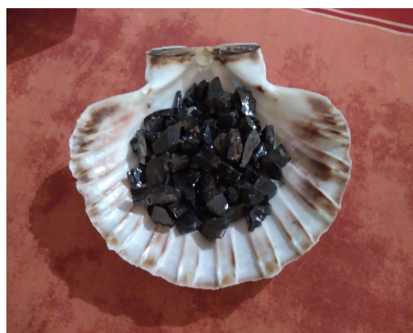
Shungite Elite brute (ou shungite argentée) en vrac (50gr environ) : morceaux de 5 à 10 mm - 40 € le lot