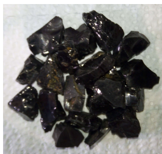
Shungite Elite brute (ou shungite argentée) en vrac (30gr environ) : morceaux de 10 à 20 mm - 40 € le lot